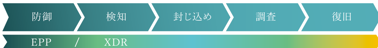
■ XDRによる防衛のながれ

XDRは、「防御」を主な目的としたウイルス対策ソフトウェアに代表される仕組み(EPP)と異なり、複数のセキュリティレイヤーで収集したイベント情報を統合して管理する機能を持った仕組みです。これにより 早期の攻撃発見、感染拡大の防止、攻撃内容や被害の把握、復旧工数の削減で被害を最小限に抑えることに貢献 します。