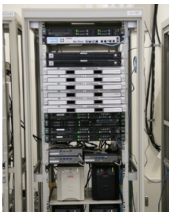
高梁キャンパス サーバルーム

「まず、設定を組み込んだインストーラーと簡易インストールマニュアルを作成しました。そして、イントラネットの学内専用ホームページに、これらをダウンロードできるページを追加し、学内ネットワークに接続する学生にそのページを通知しました。教職員にはグループウェア経由でインストーラーを配布しています。また、他社のウイルス対策ソフトを利用していた一部の学校向けには、キャノンITソリューションズからアンインストールツールを提供してもらい、こちらも学内ホームページで公開しました」